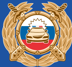
Госавтоинспекция МВД России

Буклет изготовлен по заказу Минпросвещения России в рамках реализации федеральной целевой программы «Повышение безопасности дорожного движения в 2013–2020 годах».